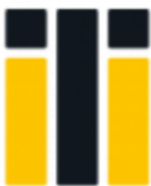
Istanbul Commerce University